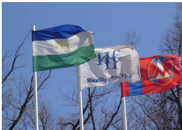
Фото 1. Флаги Башкортостана, ИнжПроектСтроя и УС-30.

Проходка четырехполосного двухсекционного тоннеля протяженностью 1249 м в створе мостового перехода через р. Уфа ведется Горностроительным комплексом СМУ-680 ФГУП УС-30 (фото 1).