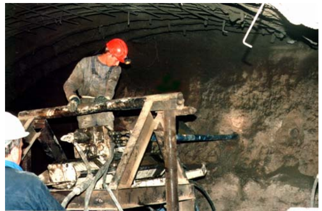
Фото 4. Устройство горизонтальных свай.

Комплекс приготовления и высоконапорной подачи цементного раствора был расположен на поверхности. Для уменьшения длины шлангов с поверхности была пробурена и обсажена вертикальная скважина, через которую в забой протянули высоконапорный шланг для подачи цементного раствора. Бурение скважин выполняли с помощью бурового станка СБГ-2ПМ, переведенного в горизонтальное положение и установленного на специально изготовленные подмости (фото 4).