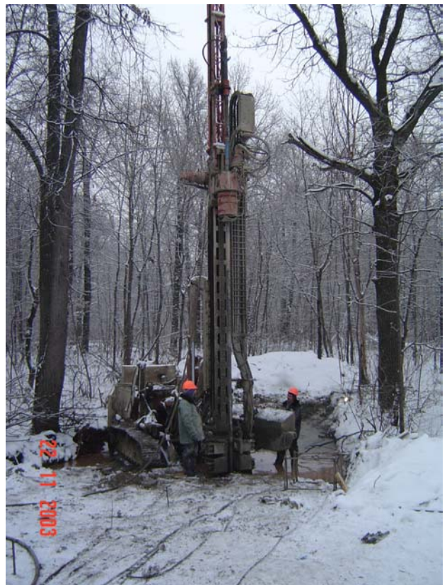
Фото 2. Производство работ на площадке.

Преимуществом данного варианта являлась возможность расположения инъекционного комплекса в удобном месте на поверхности земли. Инъекционный комплекс включал миксерную станцию TW-20, инъекционный насос TW-351 (Tecnowell, Италия), силос объемом 20 м 3 для складирования цемента, бак для воды объемом 10 м 3 , компрессорную станцию.