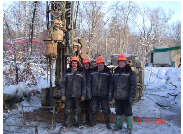
Фото 5. Бригада рабочих.

логическими аспектами, сколько временными и организационными показателями, связанными с общими перспективными планами строительства тоннеля.