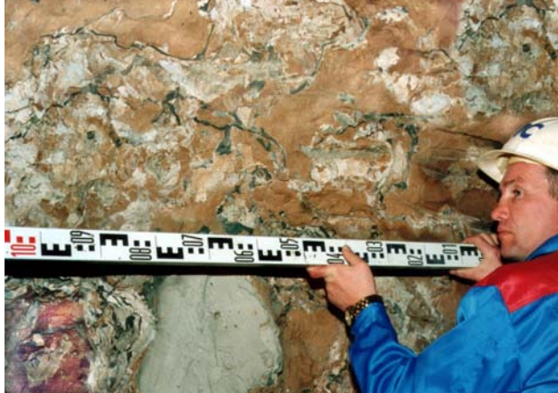
Фото 3. Контрольная камера.

областей непромешанной глины и чистого цементного камня, которым были заполнены все трещины.